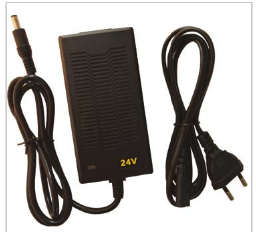
■ Batteria e carica batteria Battery and battery charger