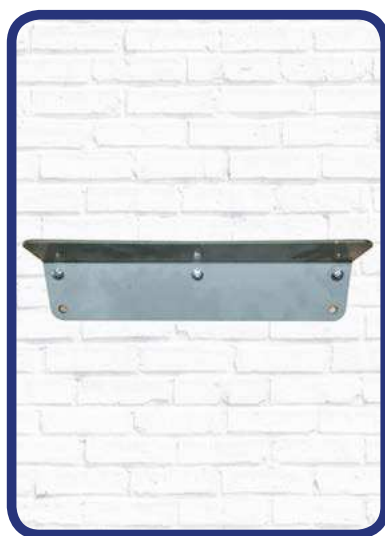
■ Attacco muro Wall bracket