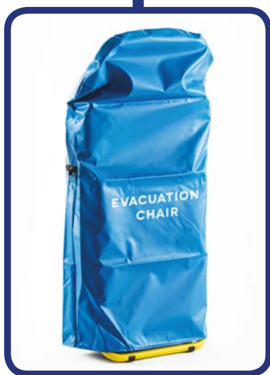
■ Cover Cover per fissaggio a muro Cover Cover for standing against the wall