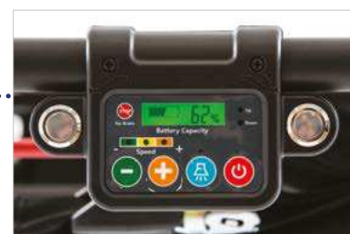
■ Quadro comandi Control panel