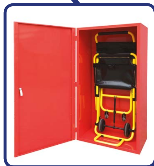
■ Cover Cover per fissaggio a muro Cover Cover for standing against the wall