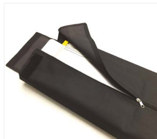
■ Borsone per AG 107 (optional) Bag for AG 107 (optional)